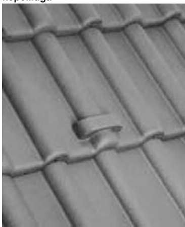
Монтаж на снегозадържаща керемида

Снегозадържащата керемида се поставя както обикновените керемиди по схема